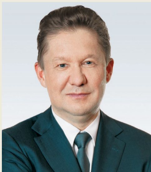
А.Б. МИЛЛЕР, Председатель Правления ПАО «Газпром»